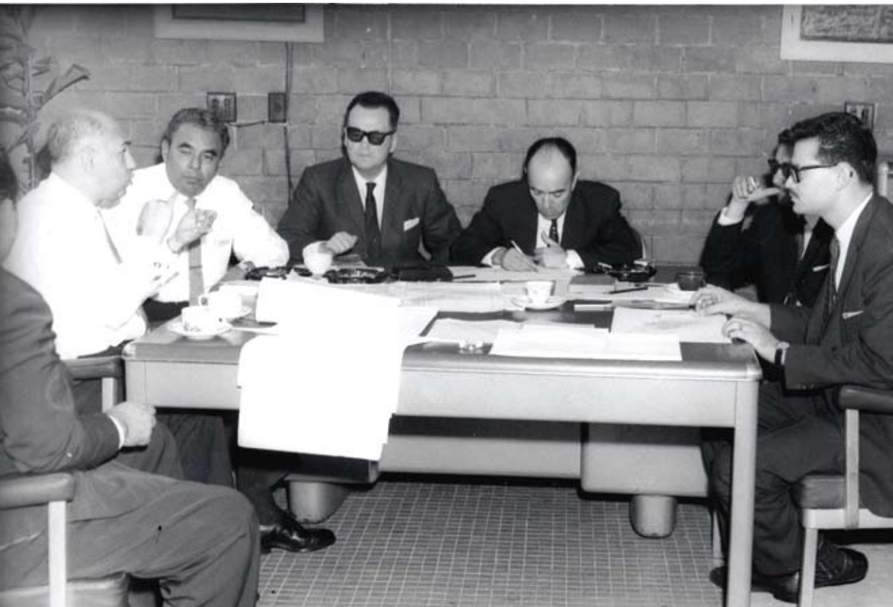
Primeros trabajos de los titulares que fundaron a la ANUIES en 1950

Como se desprende de la información anterior, la ANUIES se integra inicialmente por las once universidades públicas existentes y por 15 instituciones educativas de nivel superior; es decir, la membresía de la Asociación se identificaba con el sector público universitario (La ANUIES y la educación..., 2000: 1).