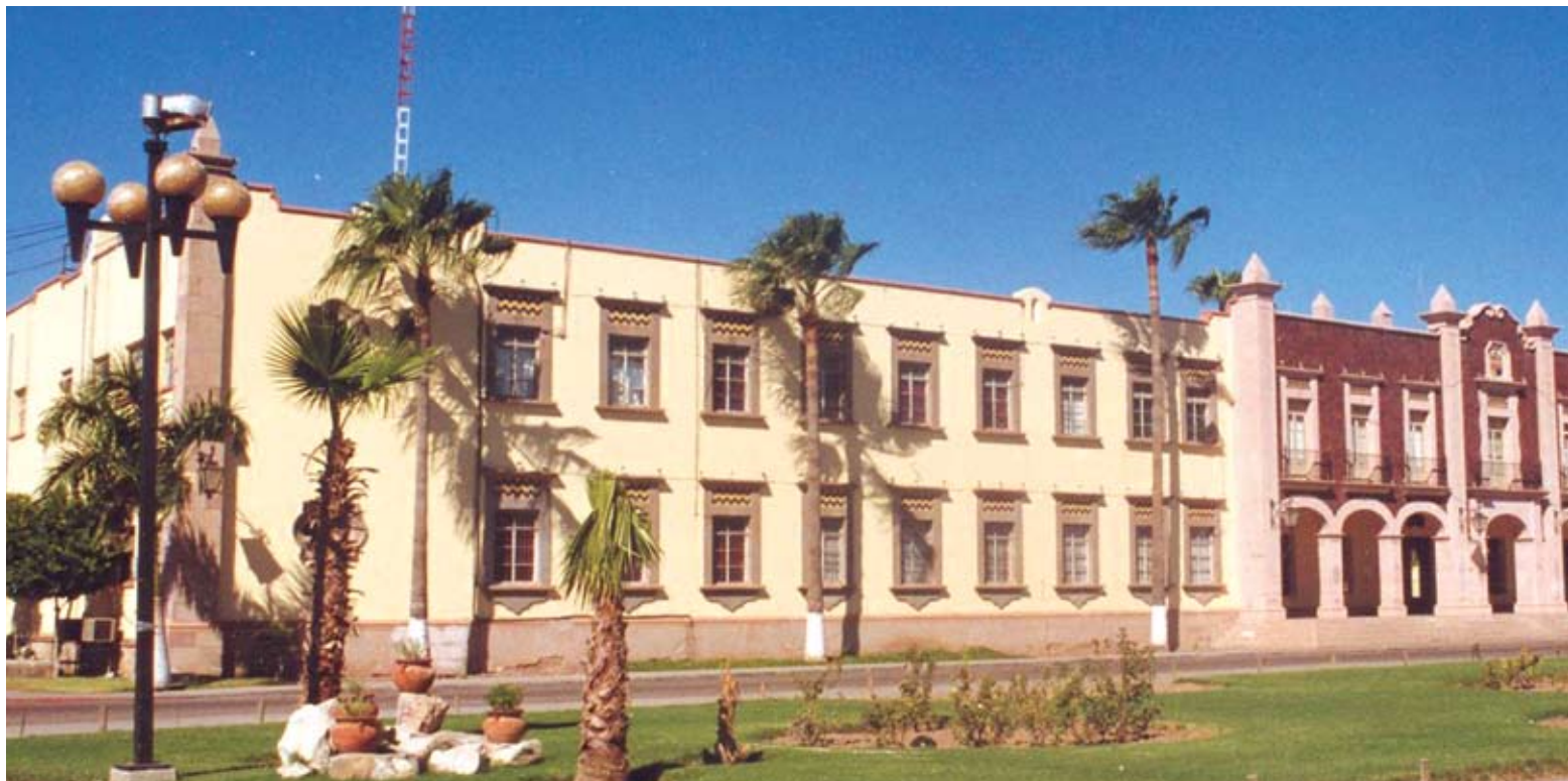
Universidad de Sonora, sede de la Asamblea Constitutiva de la ANUIES, celebrada del 21 al 26 de marzo de 1950.

En página anterior Fotografía oficial de los asistentes a la Asamblea Constitutiva de la Asociación Nacional de Universidades e Institutos de Enseñanza Superior de la República Mexicana, A. C., Marzo de 1950